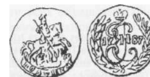
Полушка 1787 г.