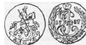
Денга 1787 г.