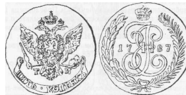
Пятак 1787 г.

Пятак имел на лицевой стороне, под императорской короной вензель императрицы, составленный из переплетен-