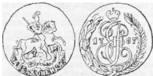
Грош 1787 г.

Пятаки 1788 г. отличаются лишь годом. Ребро у них также узорное. Монета довольно редка.