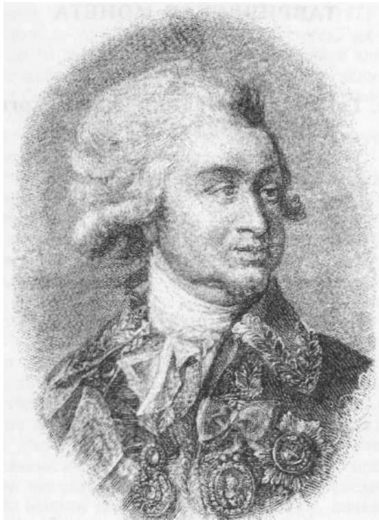
Генерал-фельдмаршал светлейший князь Григорий Александрович ПОТЕМКИН-ТАВРИЧЕСКИЙ

«Ее Императорского Величества самодержицы Всероссийской, всемилостивейшей государыни моей генерал-аншеф, главнокомандующий сухопутными Ее И. В-ва войсками в Крыму и южных Российской империи губерниях расположенных, флотами плавающими в Черном, Азовском и Каспийском морях, всей легкой конницей, Донским войском и всеми иррегулярными, Государственной военной коллегии вице-президент, екатеринославский, астраханский и саратовский генерал-губернатор, Ее Величества генерал-адеютант, действительный камергер, Кавалергардского корпуса поручик, лейб-гвардии Преображенского полка подполковник, Новотроицкого кирасирского полка шеф, над войсками генерал-инспектор и орденов российских: Св. апостола Андрея Первозванного, Св. Александра Невского, Военного Св. великомученика Георгия и Св. равноапостольного князя Владимира — больших крестов, королевско-прусского — Черного орла, датского — Слона, шведского — Серафима, польского — Белого орла и Св. Станислава и великокняжеского голстинского — Св. Анны — кавалер». (Титул Потемкина в 1783 г. Из манифеста его к калмыкам о присоединении Крыма).