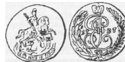
Копейка 1787 г.